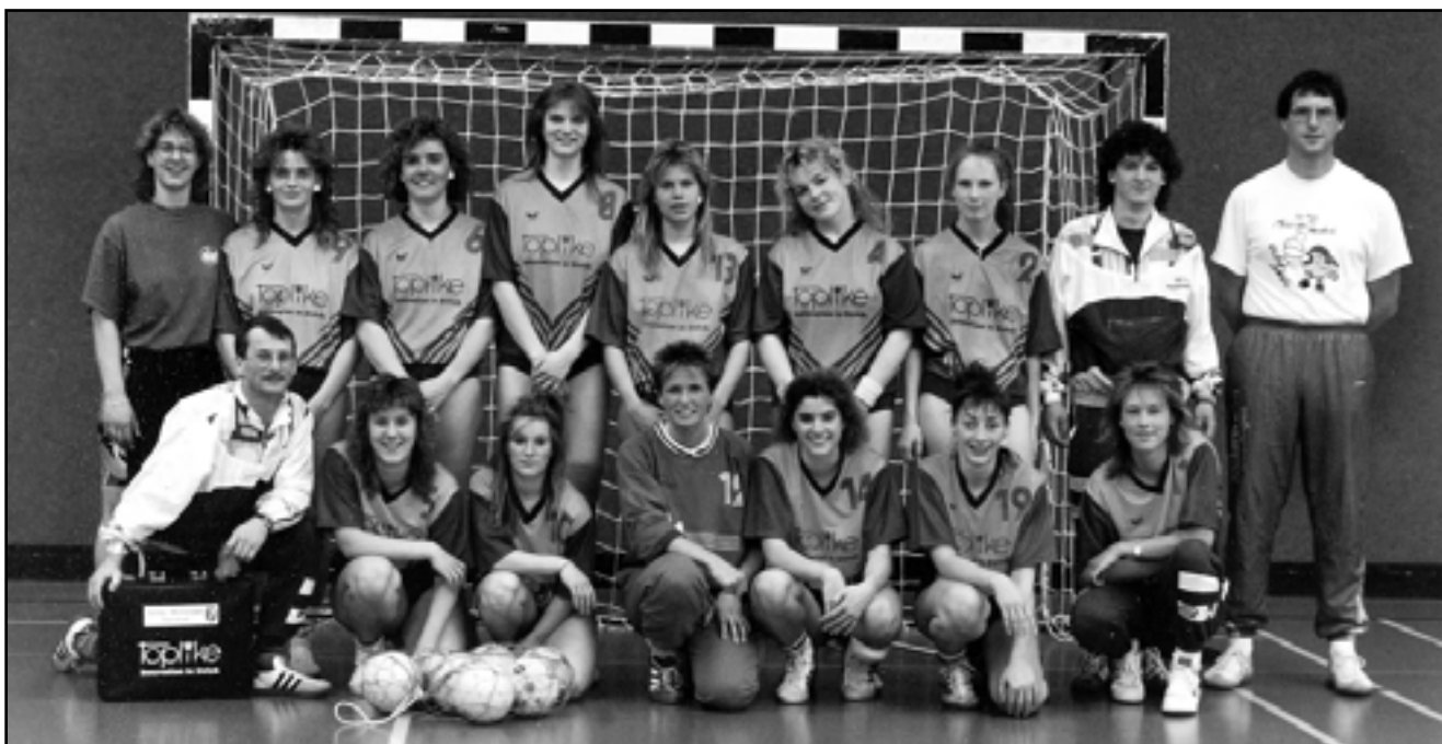
Die Verbandsliga-Meister-Mannschaft von 1991