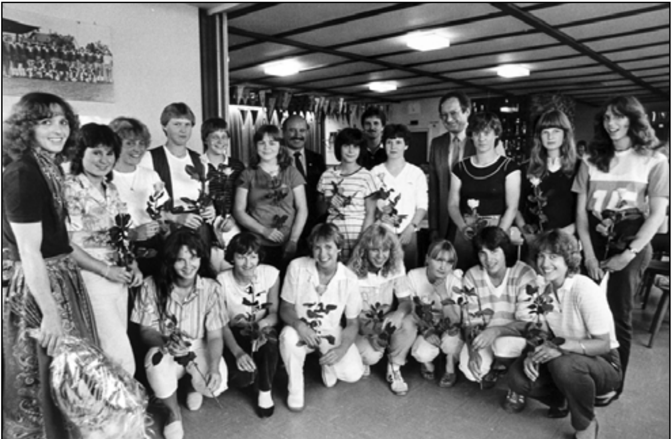
Meisterschaftsfeier am 25. Juni 1982, A-Jugend Süddeutscher Meister und B-Jugend Württembergischer Meister