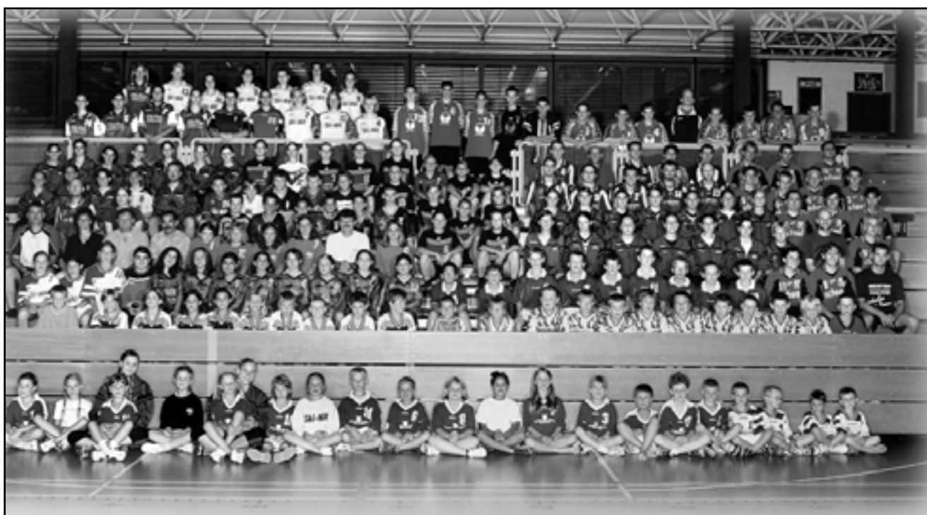
Handball-Abteilung im Juni 2003