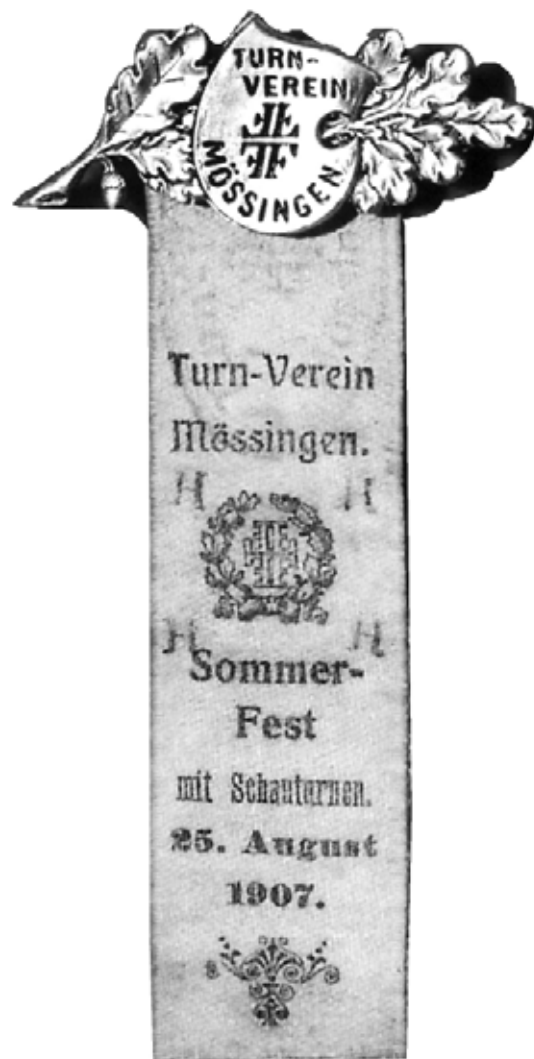
Festbändel vom Sommerfest 1907 mit Schauturnen